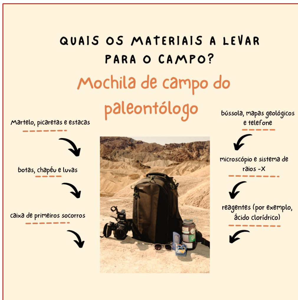
Fig. 1 – Possibilidades de materiais a colocar na “mochila de campo”.