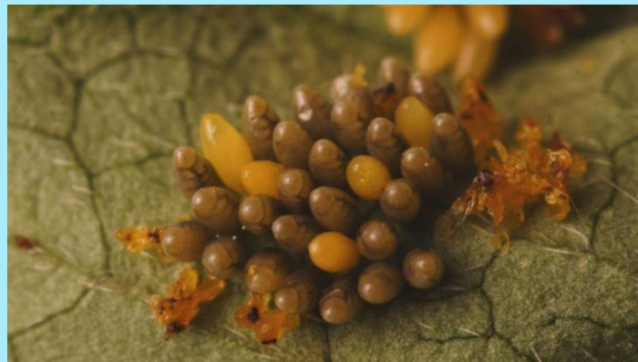
ovos de joaninha

As fêmeas colocam ovos em diversos locais, como por exemplo, na parte inferior das folhas.