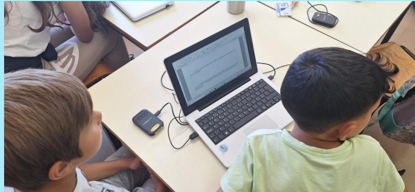
Trabalho de pesquisa em sala de aula