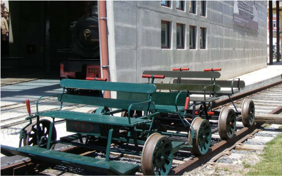
Algumas das atividades no concelho do Entroncamento realizam-se no Museu Nacional Ferroviário.

Em Abrantes, as comemorações começam uma hora antes, às 15h00, na Casa c Miguel do Rio Torto com insufláveis, modelagem de balões e um workshop de hi entretenimento infantil continua na sede do Grupo de Teatro Palha de Abrantes subida ao palco da peça "O Fio da linha do Horizonte", pelo Te-Ato – Grupo de T jogos a partir das 17h30. As duas iniciativas abrantinas incluem ainda lanches e