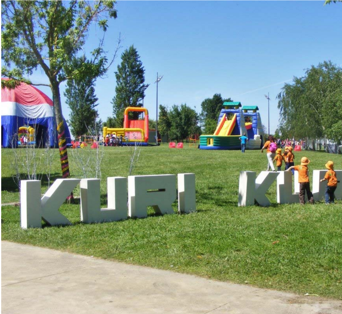
O Kuri Kuri regressa ao parque ribeirinho de Vila Nova da Barquinha.

No dia 31, quinta-feira, as atividades infantis continuam em Vila Nova da Barqui arranque de mais uma edição do “Kuri Kuri”, que transforma o parque ribeirinho magia acontece” até domingo. O festival para pais e filhos propõe insufláveis pa adultos, pinturas faciais, slide, parede de escalada, canoagem, waterball, atelier das 11h00 às 13h00 (exceto no dia 31) e das 14h00 às 20h00.