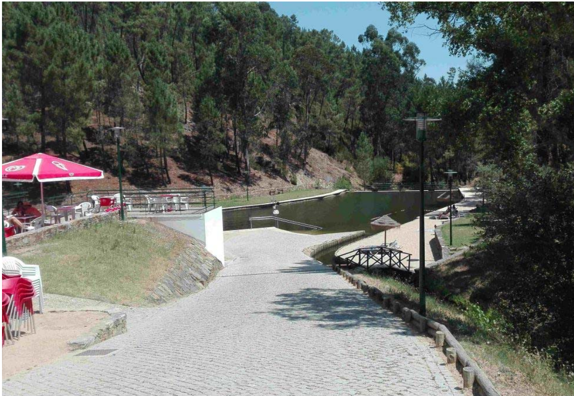
Em Mação, os alunos brincam na Praia Fluvial de Carvoeiro.

iniciativas, que começam às 09h30, encontram-se jogos tradicionais, pinturas fe desportivas e insufláveis. A elas junta-se, a partir das 10h00, o projeto “Bora Lá Jogar à Bola”, promovido pela Associação de Futebol de Santarém. Também às crianças podem pular nos insufláveis “Super Dance Kids” e “Um Abraço Verde”, Desportivo Municipal do Entroncamento.