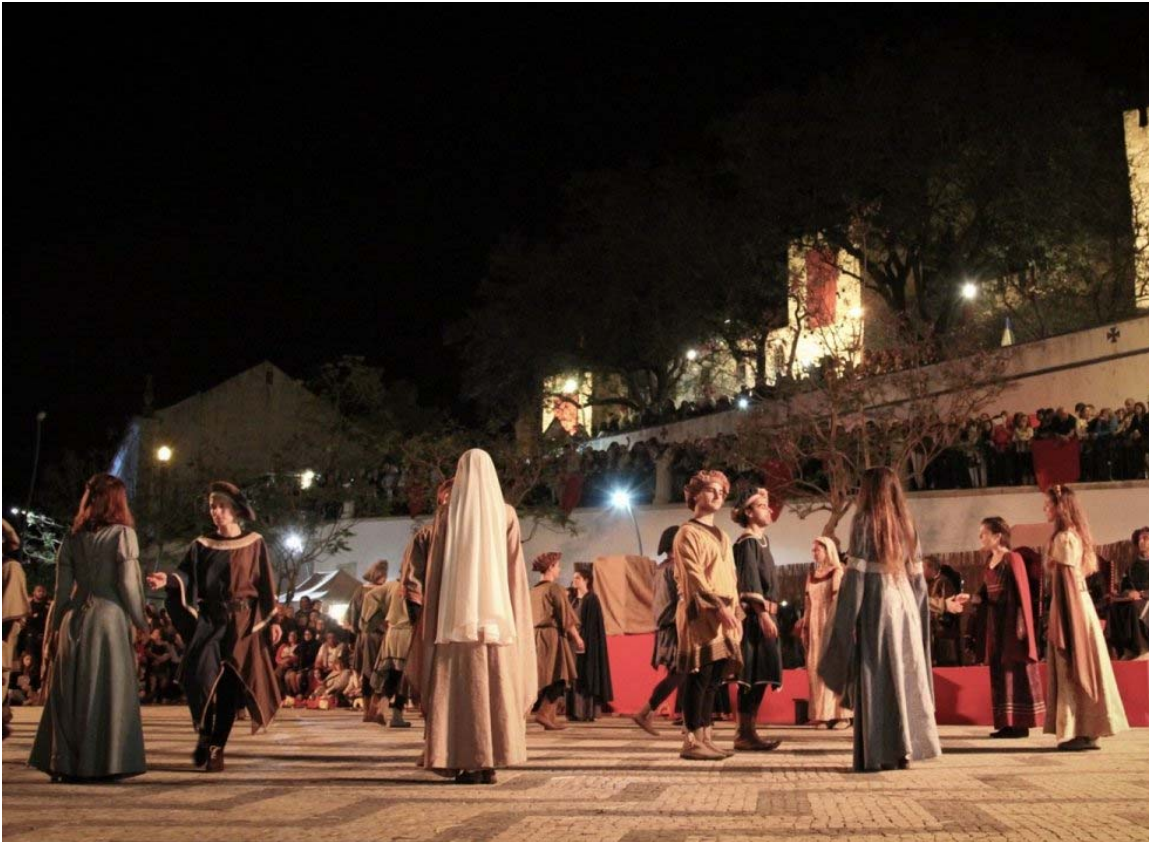
Uma das viagens no tempo realiza-se durante a Feira de Época de Torres Novas.

Após o baile, os “petizes” podem dormir descansados e acordar cheios de energia para as iniciativas do fim-de-semana, começando no sábado, dia 2, no Entroncamento com o atelier “Casinhas em Madeira com Massa Foam” a partir das 09h30 na Praça das Crianças continuam a divertir-se no concelho e, às 11h30, podem praticar yoga Municipal.