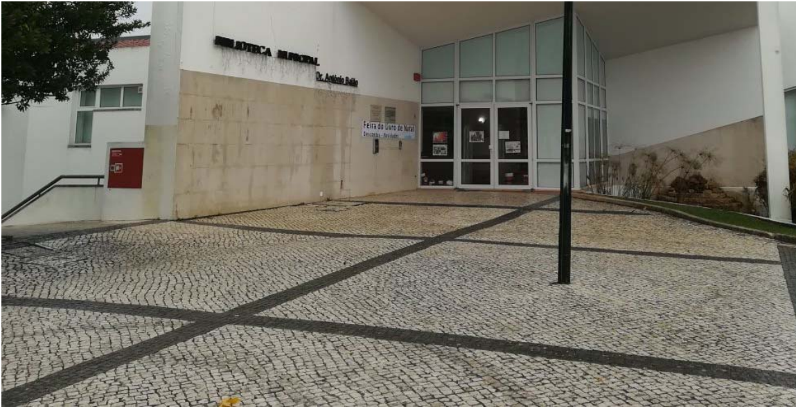
A Biblioteca Municipal Dr. António Baião, em Ferreira do Zêzere, desafia as famílias com um atelier criativo. F

A festa infantil continua no dia 3, com o Festival de Papagaios e batismos de bal no Castelo / Fortaleza de Abrantes marcado para as 10h00. À tarde, a pequenac Tomar, onde o programa do último dia da Mostra de Teatro de Cem Soldos suger partir das 15h00 no Largo do Rossio e palhaçadas dos “Os Trabucas” pelas 16h3 “Capitão Miau Miau” aparece no Centro Cultural do Entroncamento para cantar c teatro apresentada pela companhia Teatroesfera.