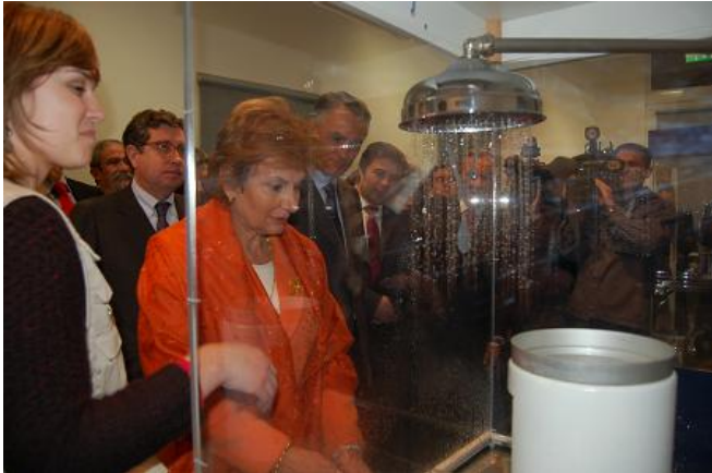
O Centro Ciência Viva do Alviela – CARSOSCÓPIO foi inaugurado no sábado pelo Presidente da República

Presidente da República classifica as exposições interactivas como uma “sensação que vale a pena experimentar” e Ministro da Ciência louva a “iniciativa, persistência e visão” da Câmara Municipal de Alcanena