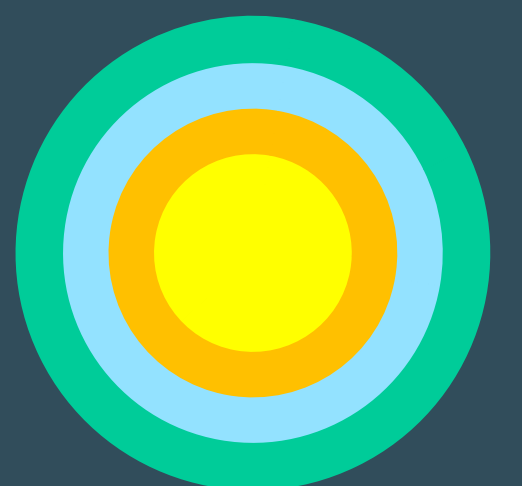
Tabela 1: esquematização geral das temáticas da investigação em curso, por determinante