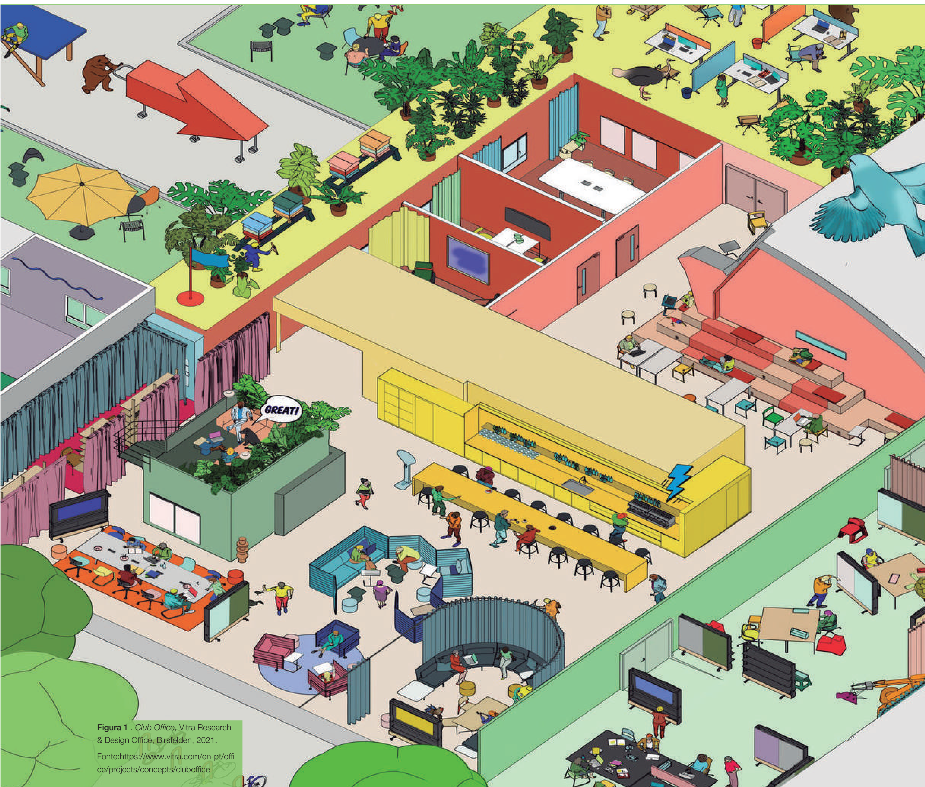
Figura 1. Club Office, Vitra Research & Design Office, Birsfelden, 2021.