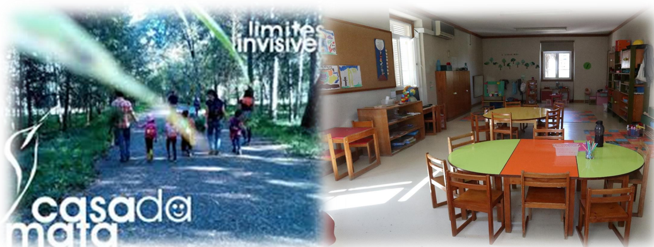
Fig. 2: Programa Casa da Mata (no Choupal, em Coimbra), do projeto Limites Invisíveis e sala de um jardim-de-infância de Coimbra

Q1: Quais as potencialidades e limitações de uma abordagem articulada e colaborativa de práticas desenvolvidas num programa de educação na natureza e no jardim-de-infância?