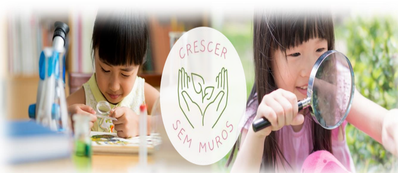
Fig. 3: Logotipo do Recurso Digital de Apoio

Desenho, programação e divulgação do Website "Crescer sem Muros"