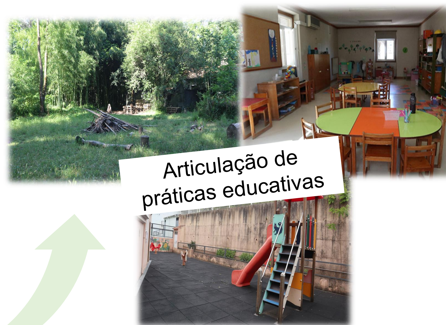
Fig. 1: Fotografias de espaços natureza, exterior e interior em contextos de infância