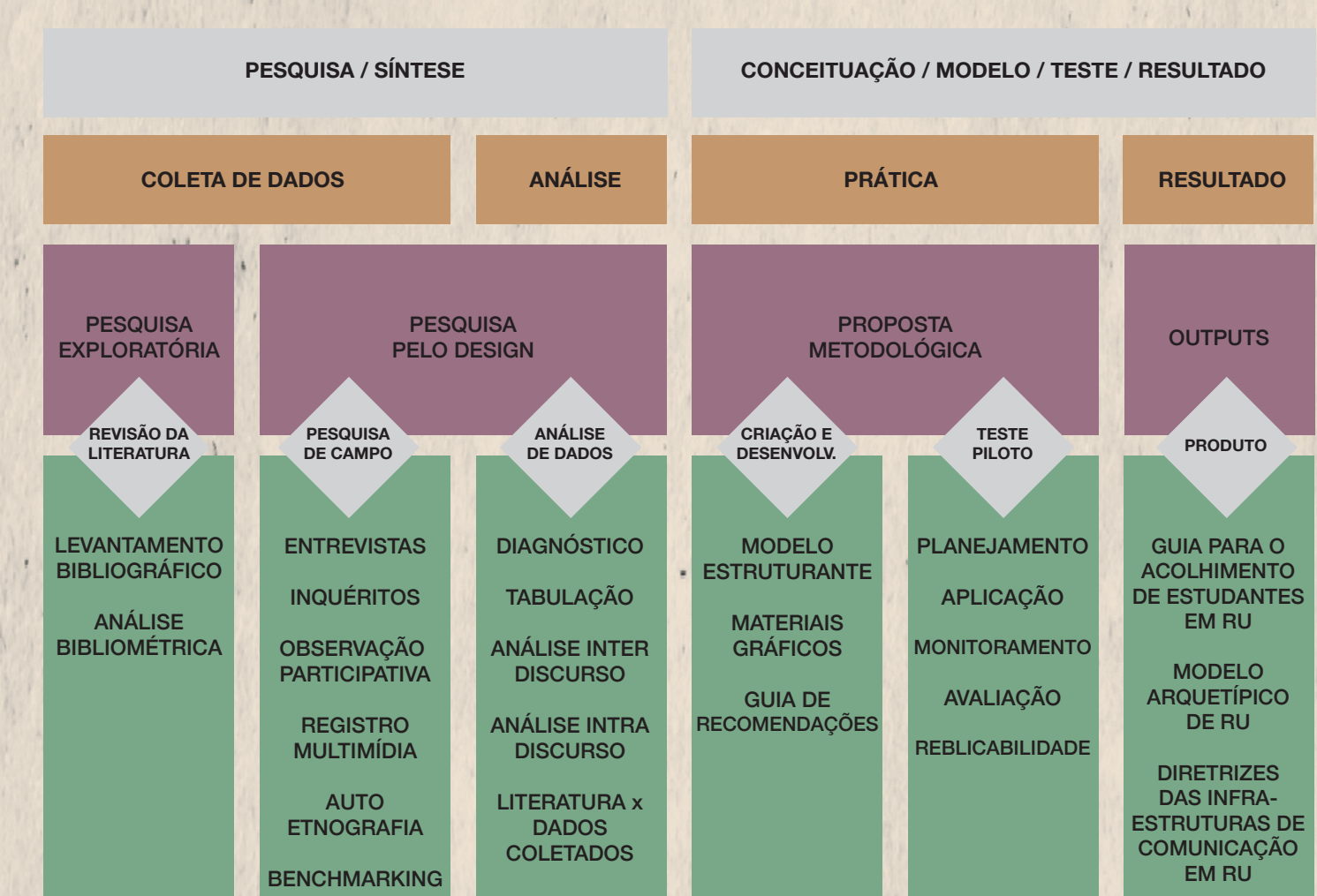
Procedimento de investigação.

Teórico-prático. Apresenta estudo multidisciplinar baseado no design e ciências sociais e aplicado em uma investigação etnográfica com estudo de caso com estudantes residentes nas onze Residências da Universidade do Porto, acrescidos por um estudo comparativo com outras Residências Universitárias e culturas universitárias europeias.