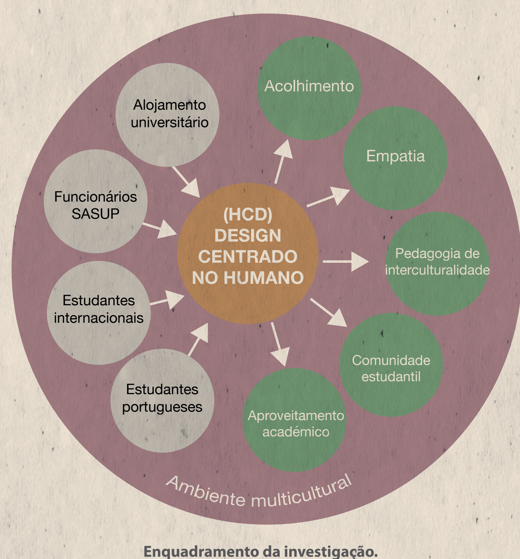
Enquadramento da investigação.

A existência de segregação cultural entre estudantes portugueses e internacionais dentro das residências universitárias, assim como o baixo sentimento de pertencimento destes estudantes nestes espaços são problemas complexos que foram agravados durante a atual crise pandémica e evidenciam uma pertinência acrescida em promover a empatia em meio a uma atmosfera de distanciamento e medo do outro. Estas questões representam uma extensão do ambiente universitário e refletem a necessidade de uma maior amplitude de acolhimento, que considere os aspectos socioculturais necessários de atenção nestes micro-universos e promova a empatia entre os residentes e entre a instituição e os estudantes.