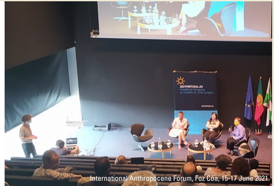
International Anthropocene Forum, Foz Côa, 15-17 June 2021