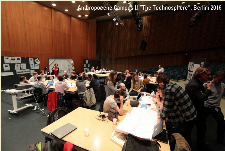
Anthropocene Campus II "The Technosphere", Berlim 2016