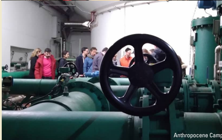
Anthropocene Campus Lisboa: Parallax, 2020