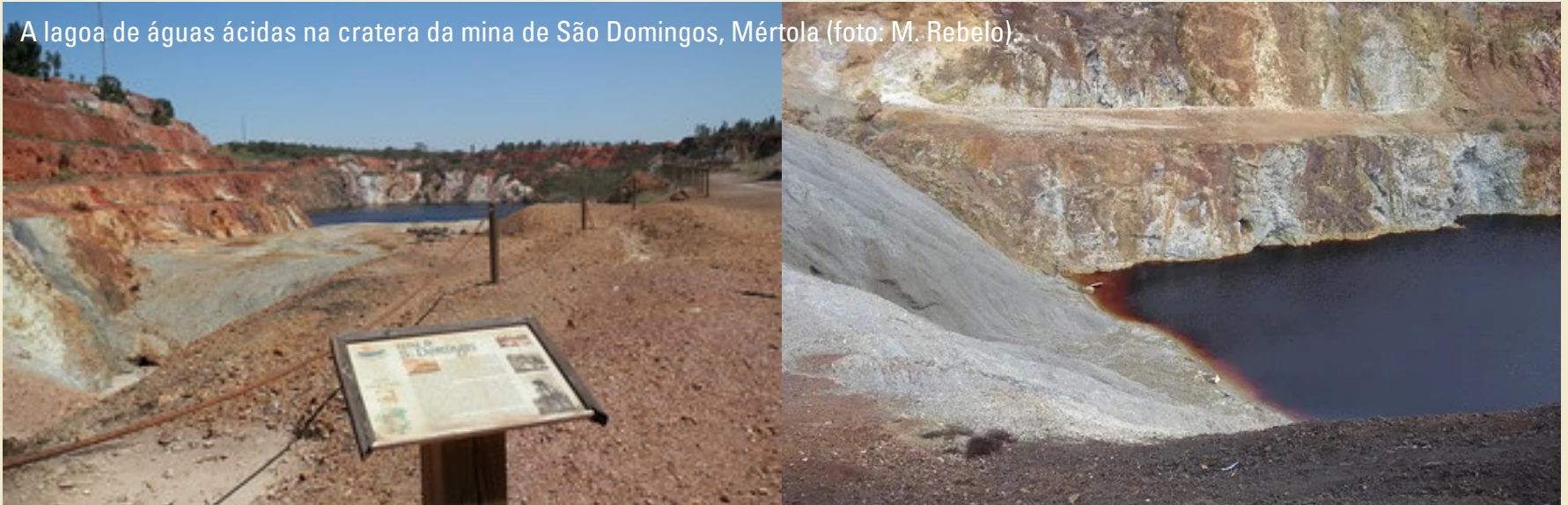
A lagoa de águas ácidas na cratera da mina de São Domingos, Mértola (foto: M. Rebelo).