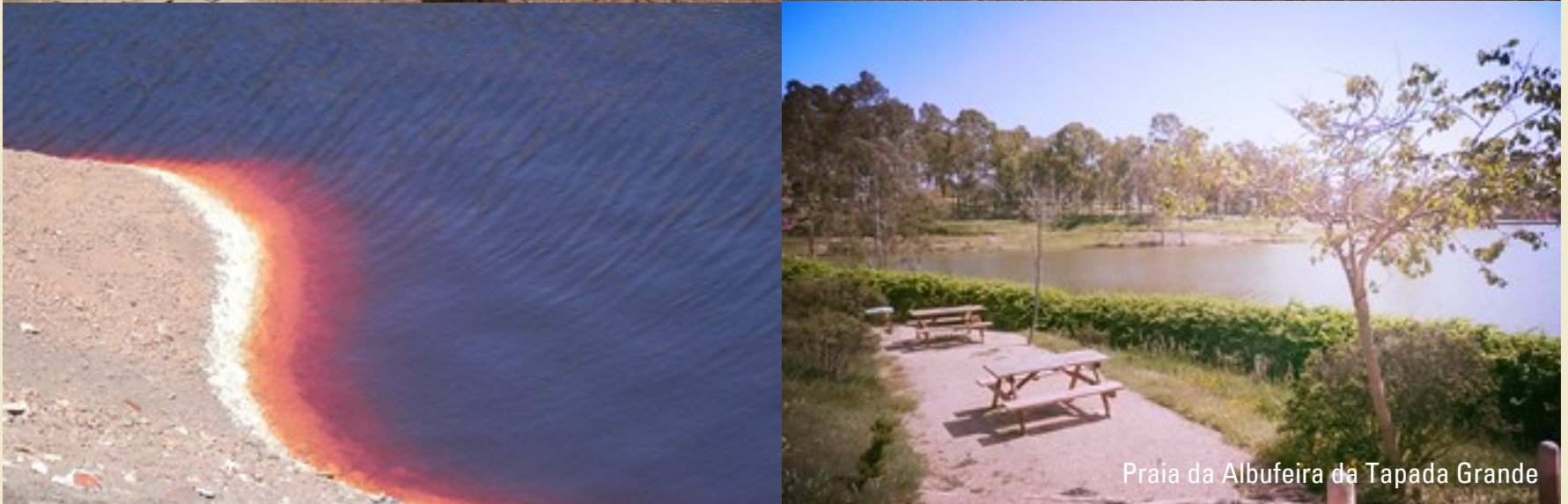
Praia da Albufeira da Tapada Grande