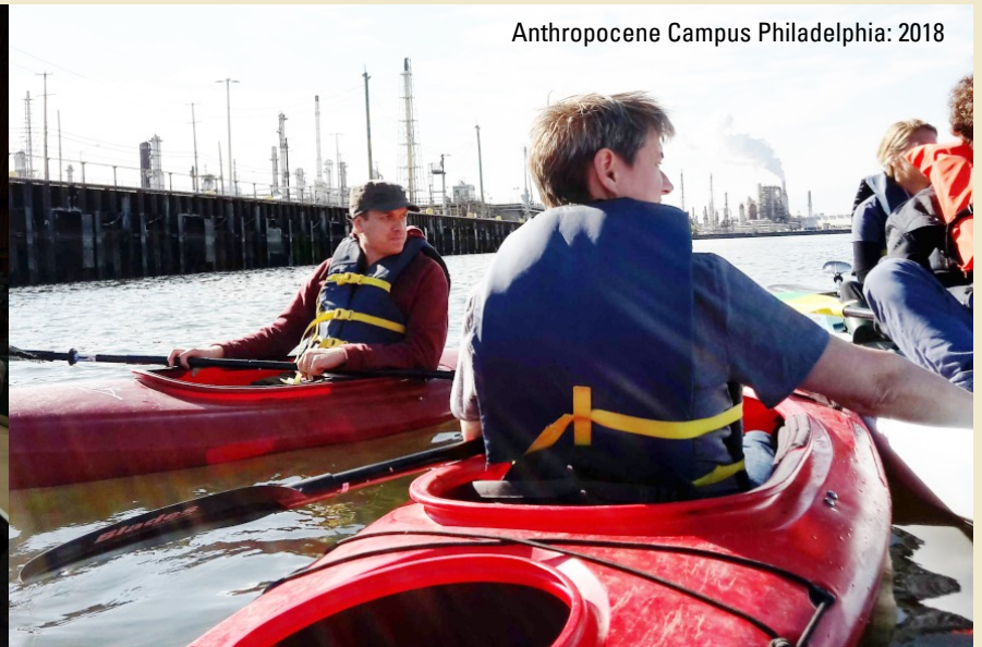
Anthropocene Campus Philadelphia: 2018