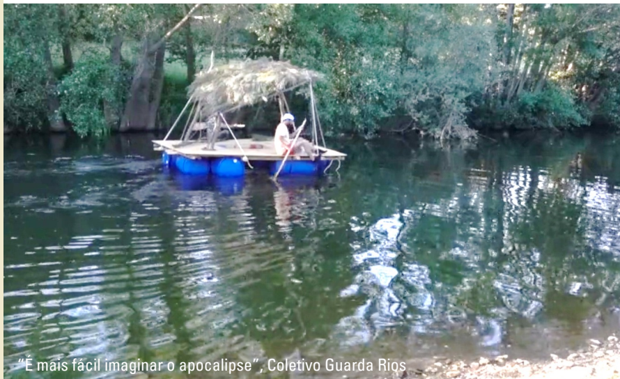
“É mais fácil imaginar o apocalipse”, Coletivo Guarda Rios

REPÚBLICA PORTUGUESA CIÊNCIA, TECNOLOGIA E INOVAÇÃO SUPERIOR